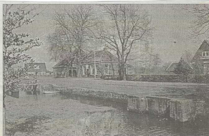
Opname van de sluis met de voormalige sluiswachterswoning bij Rodeschuur onder Augustinusga.

Dit was een publicatie namens de Stichting Oud-Achtkarspelen.