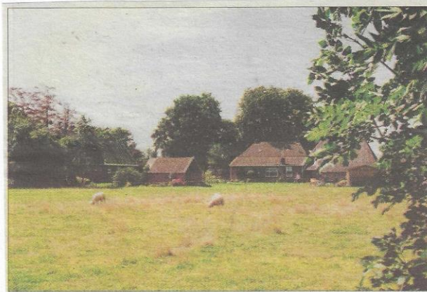
Bij Roodeschuur onder Augustinusga in de zomer van 2007.